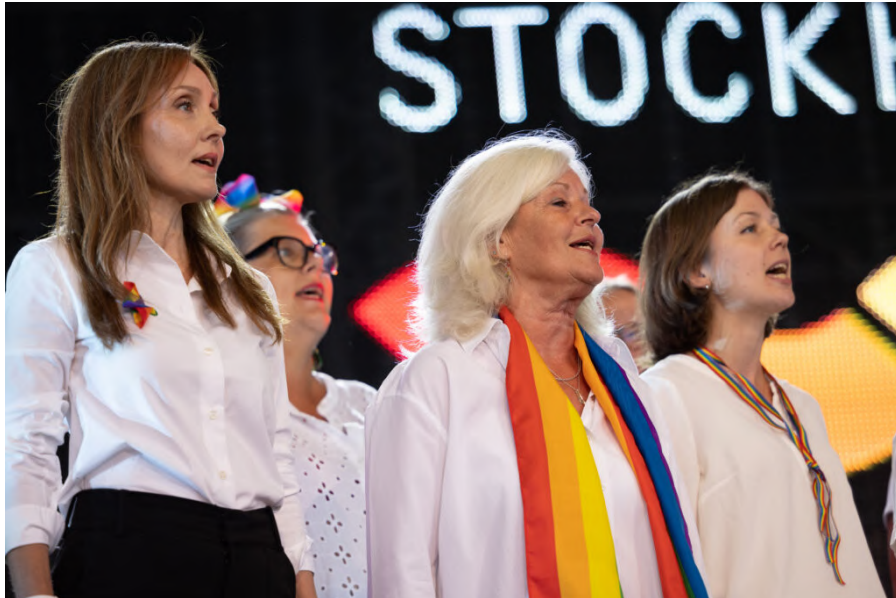
Kvinnokören Sapphonia på scen den andra augusti under invigningen.

På torsdagskvällen den tredje augusti drog den traditionsenliga schlagerkvällen igång med en fantastisk uppställning av artister. Och det undgick väl ingen att den tvåfaldiga eurovisionvinnaren och mellolegendaren Loreen bidrog med ett fantastiskt framträdande inför en överraskad publik. Hon tog scenen med storm och lät inte regnet komma i vägen mellan henne och publiken!