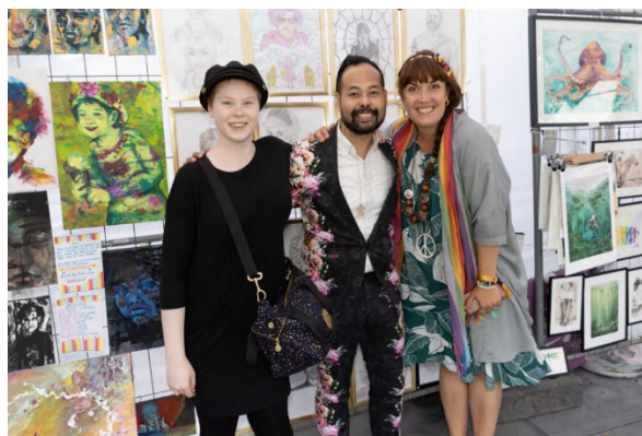
Mingel i Konstnärstältet.