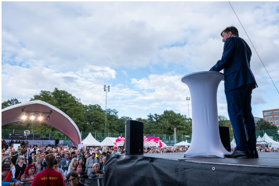
Andreas Norlén under invigningstalet i Park, 2023.