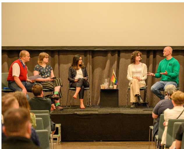
Pride House-Chef HP och Pridehunden Från seminariet: Jämställd idrott för transpersoner