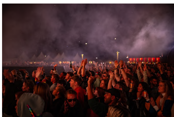
Mingelbild från Park.