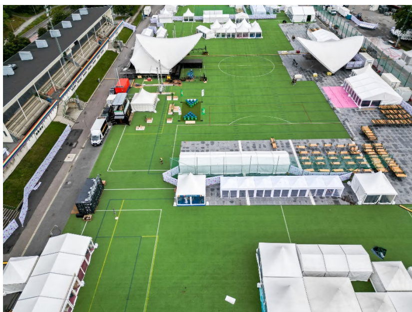
Ett folktomt Östermalms IP.