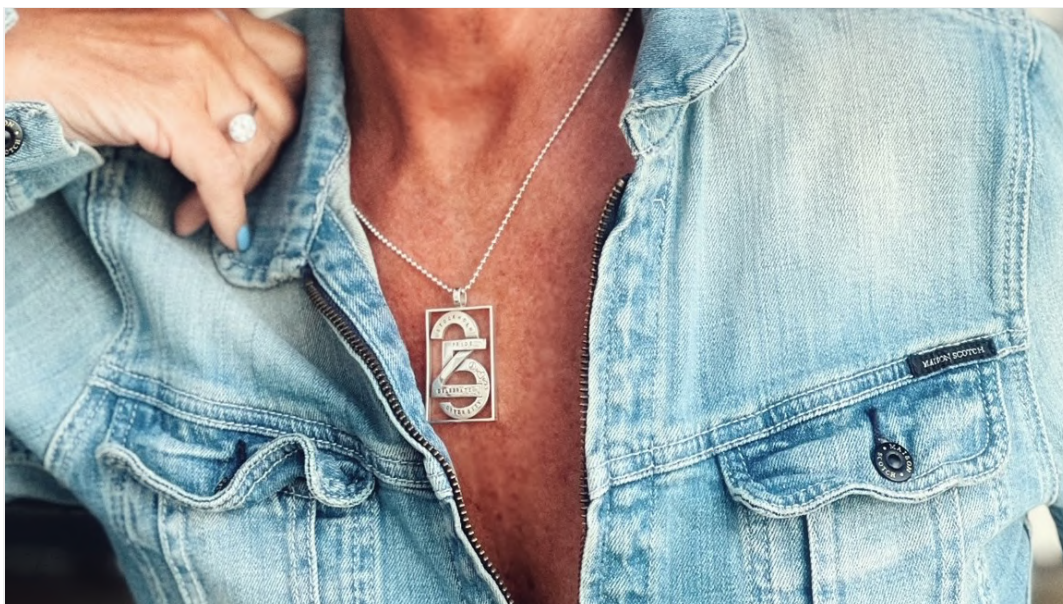
Årets dog tag 2023.

Stockholm Pride firade 25 år genom att välkomna tillbaka Efva Attling som designer av årets DogTag – Stockholm Prides 25:e och sista DogTag. Att få knyta ihop säcken gällande dogtags där Efva som designade den första dogtagen 1998 nu kunde designa den sista och på det uppmärksamma 25-årsfirandet kändes perfekt. Årets smycke var framtaget med extra kärlek och omtanke och ämnade föra in ett tidsperspektiv, därmed var siffran 25 ett givet moment.