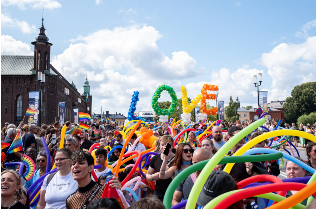
Pride Parade 2023 framför stadshuset.